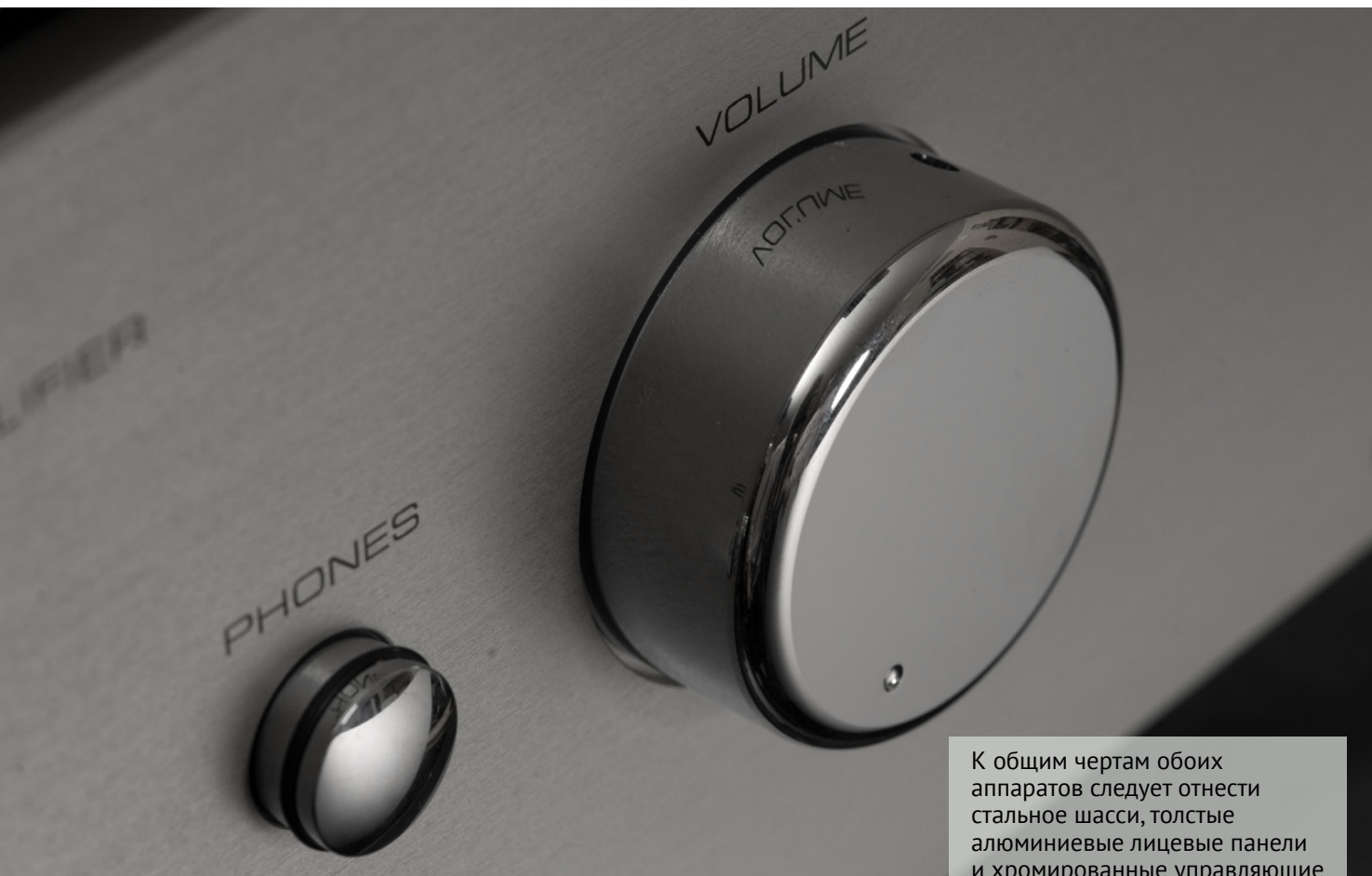
К общим чертам обоих аппаратов следует отнести стальное шасси, толстые алюминиевые лицевые панели и хромированные управляющие элементы из латуни.

Было принято решение для первоначального прослушивания использовать уже отслушанный и прогретый усилитель стороннего производителя. Подключаем к нему тестируемый проигрыватель, сдвигаем крышку, ставим диск, устанавливаем сверху прижим, запускаем... Voila! В и без того добротном породистом звучании предыдущего комплекта появилось третье измерение. Звучание, не утратив богатства красок, наполнилось воздухом и стало «светлее». К светлым краскам добавилась легкость восприятия. Кажется, что этот звук можно слушать бесконечно, и он не надоест. Прослушивание из работы превратилось в отдых.